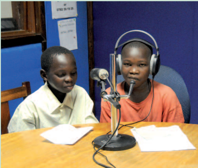
Gente pequeña, grandes palabras: niños de Arua (Uganda) en un programa radiofónico apoyado por ustedes.

“También en el mundo digital se debe poner de manifiesto que la solicitud amorosa de Dios en Cristo por nosotros no es algo del pasado, ni el resultado de teorías eruditas, sino una realidad muy concreta y actual”.