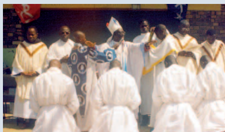
Unidad en Cristo: los seminaristas reciben la bendición de su obispo.

El diálogo entre los mismos cristianos es también un presupuesto de la reconciliación. En la diócesis de Kasongo (Rep. Democrática del Congo), marcada por una larga guerra civil, incluso los sacerdotes se muestran desconfiados y desunidos entre sí.