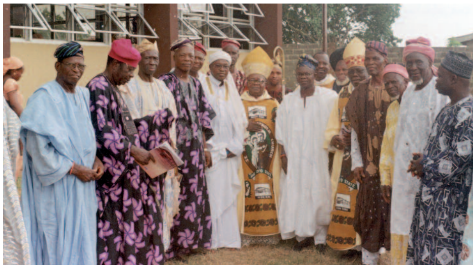
Diálogo a ejemplo del Encuentro Mundial de la Oración en Asís: de este modo deben hacerse visibles los valores de la libertad religiosa, el respeto mutuo y la amistad, también en Oyo (Nigeria).

El misterio de la reconciliación es el misterio del amor: “Toda la historia de la humanidad es la historia de la necesidad de amar y de ser amado”. Esta frase del Beato Juan Pablo II, dirigida a la juventud de Francia, vale para todos los hombres. Constituye el resumen de la historia de la salvación y la reconciliación.