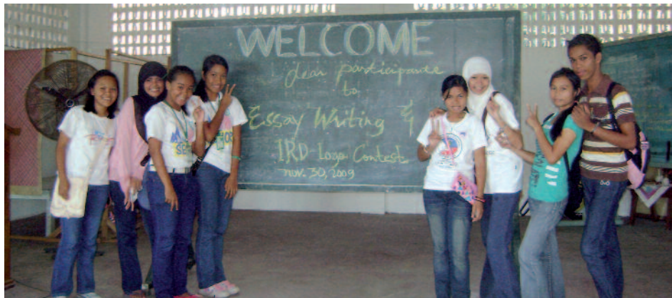
Material docente al servicio de la verdad: los jóvenes son los principales beneficiados de la imprenta de la diócesis de Ruteng (Indonesia).

Debería ser más. Pero tenemos otros proyectos de apostolado de los medios: los programas religiosos de Radio Sol Mansi , en Guinea Bissau , que no serían posibles sin la ayuda de ustedes ( 6 millones 780 mil pesos ). O la revista Istina-Veritas , órgano oficial de la Conferencia Episcopal Búlgara y único periódico católico de Bulgaria ( 2 millones 712 mil pesos ). O también una pequeña imprenta para la diócesis de Ruteng ( Indonesia ) con la que se podrá preparar el material docente para catequistas y clases de religión en las escuelas de 77 parroquias ( 6 millones 102 mil pesos ). Estos y otros muchos proyectos tienen como meta “el desarrollo integral del hombre” y la satisfacción de las “auténticas necesidades espirituales” (Benedicto XVI). Sin los medios esto no sería posible.