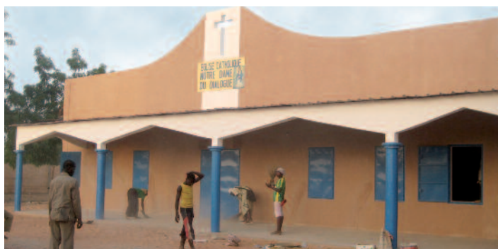
El diálogo se convirtió en piedra: en Konni (Níger) edifican los cristianos, junto con los musulmanes, el lugar de oración “Nuestra Señora del Diálogo”.

Así se mantienen los cristianos dispuestos a la reconciliación, tal como la describe Benedicto XVI en su libro sobre Jesús. “El cristiano debe orientarse en el fervor del amor y la cruz”. Para realizar este trabajo en el fundamento del amor, la Comunidad necesita devocionarios, Biblias, catecismos y ayuda para los viajes misioneros ( 10 millones 169 mil pesos ). ●