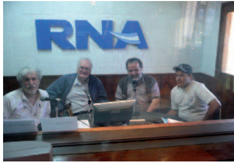
En el estudio o directamente a las personas: el Centro “Nuestra Señora de Luján”, en Buenos Aires, difunde el Evangelio de formas distintas.