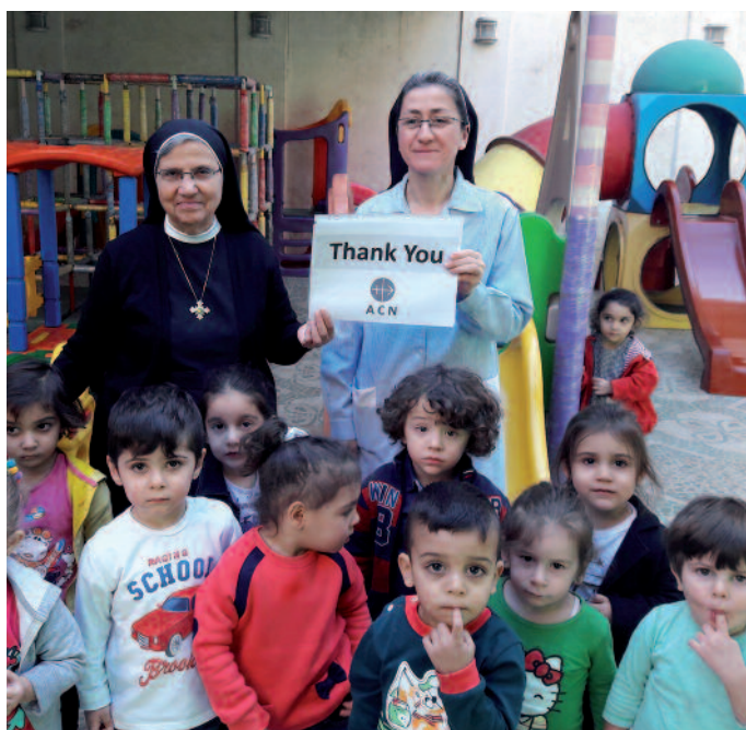
En el renovado jardín de infancia de las Hermanas de Nuestra Señora del Perpetuo Socorro en Alepo: Su gratitud es también la de muchas religiosas, niños y cristianos perseguidos de todo el mundo.

Más allá de todo ello, precisamente ahora toca seguir cumpliendo con las tareas catequéticas en Asia y Latinoamérica, donde los desmanes de las sectas están dañando considerablemente a la Iglesia y a los creyentes.