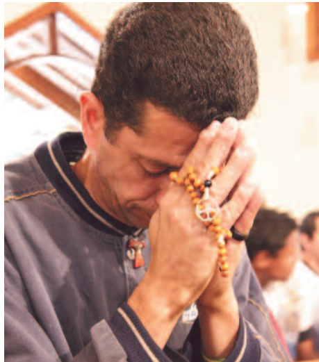
Guatemala: Un misterio del Rosario es siempre para ustedes.

Esta confianza es cosa de fe, es cosa de los orantes. Dios le hace a San Pedro una promesa: “El poder de la Muerte no prevalecerá contra mi Iglesia” (Mt 16,18). Mientras que en Europa la Iglesia se está