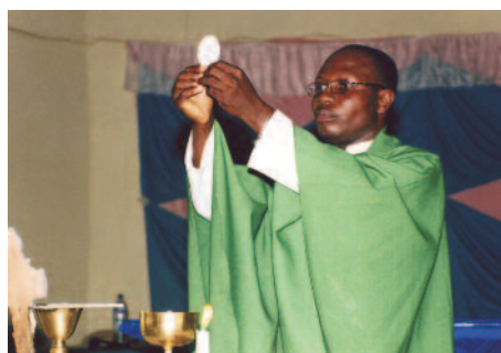
Ghana: "Este es mi cuerpo": toda misa es siempre un acontecimiento mundial.

mación sólida, cultural y científica, y que unos estudios intensos y consistentes favorecen el desarrollo de una personalidad madura. Pero para ello se necesitan buenos profesores. El problema es que, en Uganda , un profesor universitario gana unos 722 mil pesos, mientras que en un seminario mayor los docentes solo perciben 72 mil pesos. Por otro lado, estos no tienen tiempo para dedicarse a una parroquia o a otro trabajo, porque la formación de los futuros sacerdotes exige un gran esmero y un compromiso que va más allá de la mera transmisión de conoci-