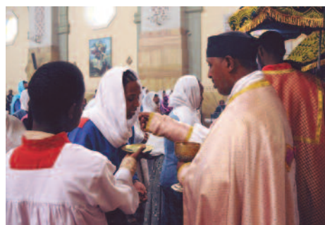
Etiopía: El cuerpo de Cristo; sin el sacerdote, sólo un pedazo de pan.

Las intenciones de Misa dan vida a la Iglesia y a los sacerdotes, porque estos perciben por ellos el lazo de amor que nos une a todos y que toma forma en la Santa Misa. Cuando rezan en la Santa Misa "Congregas a Tu pueblo sin cesar, para que se haga el sacrificio puro a Tu nombre desde la salida del sol hasta su ocaso", entonces también anuncian la comunidad universal. Las intenciones de Misa son más que una ayuda a la subsistencia. El Obispo de Kandi ( Benín ) les da las gracias en nombre de sus sacerdotes y escribe que los bienhechores participan "activamente en la santificación de nuestros sacerdotes". El número de sacerdotes aumenta en todo el mundo, pero el número de intenciones de Misa disminuye. ¡Invirtamos esta tendencia! ¡Nuestros sacerdotes se lo merecen! ●