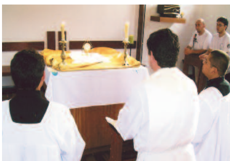
Brasil, Diócesis de Caraguatatuba: la adoración, el comienzo de toda actividad.