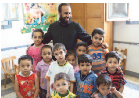
Pastoral infantil en Egipto: Dejad que los niños vengan a mí...