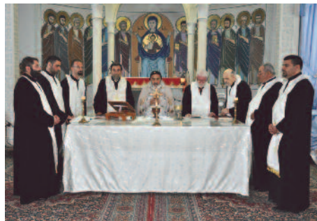
Homs, ciudad de mártires en Siria: "mi cuerpo, entregado por vosotros".