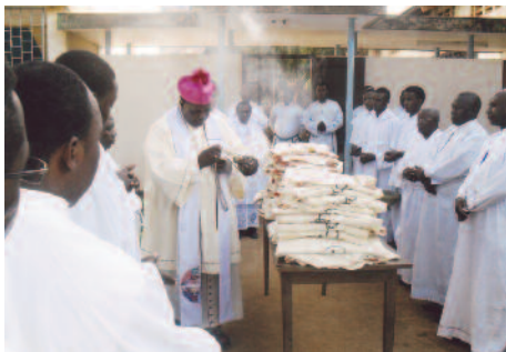
Tanzania: El Obispo de Morogora consagra las vestiduras de los nuevos sacerdotes.

La Misa es la vida de Iglesia... y también la de los sacerdotes.