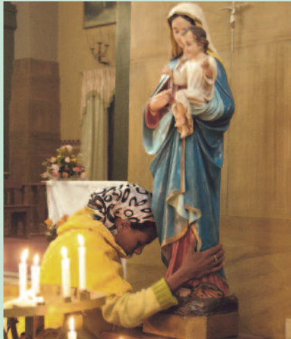
En Addis Abeba: Apoyo de los cristianos, consoladora de los tristes, Reina del Santo Rosario...

“El Santo Rosario no es una práctica piadosa del pasado, como oración de otros tiempos en los que se podría pensar con nostalgia. Al contrario, el Rosario está experimentando una nueva primavera. No cabe duda de que este es uno de los signos más elocuentes del amor que las generaciones jóvenes sienten por Jesús y por su Madre, María.”