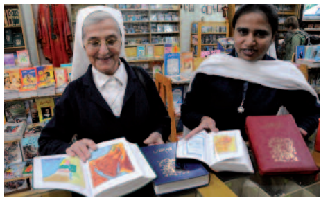
Pakistán: Las minorías son las que más necesitan un conocimiento profundo de la fe. A ello sirve, por ejemplo, una biblioteca con la Biblia en la lengua materna urdu.

Biblias en la lengua materna, libros de catequesis y folletos pastorales, libros para los seminarios: “Cada bautizado, como testigo de Cristo, debe adquirir una formación correlativa a su condición, para dar consistencia a su testimonio del Evangelio” (Beato Juan Pablo II). Voluntad no falta, pero a menudo escasean los medios. Esta es, pues, nuestra hora.