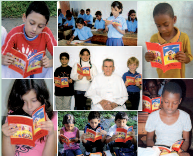
“Dios habla a sus hijos, cincuenta millones de ejemplares en los cinco continentes: la Biblia en manos de los niños.”

No hay prioridad más grande que ésta: abrir de nuevo al hombre de hoy el acceso a Dios, al Dios que habla y nos comunica su amor para que tengamos vida abundante.