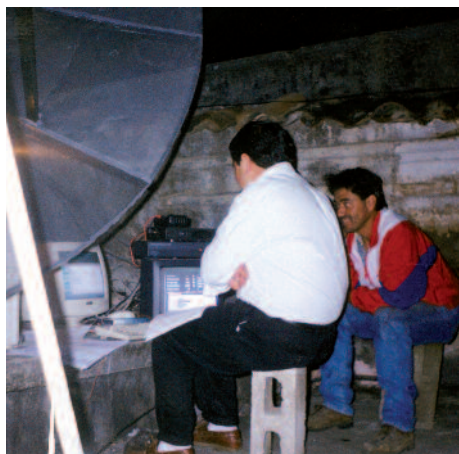
Guatemala: emisora católica contra la marea de las sectas.