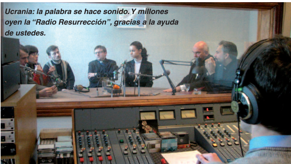
Ucrania: la palabra se hace sonido. Y millones oyen la “Radio Resurrección”, gracias a la ayuda de ustedes.