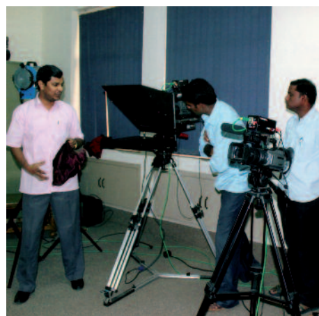
India: Aquí sacerdotes y laicos aprenden a hablar ante las cámaras .

“La ignorancia es el peor enemigo de nuestra fe”, dice el Beato Juan Pablo II. Los medios de comunicación pueden transmitir y difundir el conocimiento de la fe. Pueden promover el diálogo sobre los valores de una sociedad. Un papel especial juegan en ello los medios electrónicos, pues afectan de modo singular a los sentimientos.