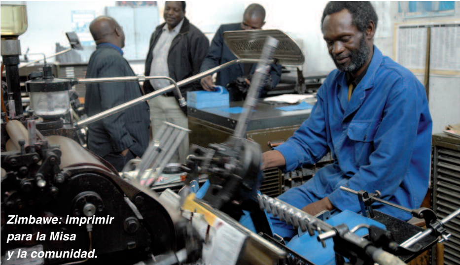
Zimbabue: imprimir para la Misa y la comunidad.

Después de San Pedro lo hicieron también muchos Papas hasta hoy. La tarea misionera que late en el concepto de Buena Nueva necesita medios adecuados. Sobre todo cuando las circunstancias sociales son difíciles. En el nordeste de Zimbabue , en la diócesis de Chinhoyi, donde viven unos 100.000 católicos dispersos por el campo y sin medios para viajar, durante un tiempo el medio de comunicación más difundido fue la hoja diocesana. No sólo ofrecía noticias de la vida de la diócesis, sino también material formativo para los catequistas. Un día se dispararon los costes de impresión. Ahora la alternativa es o bien utilizar una impresora propia o aportar