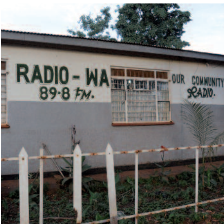
Uganda: la Radio Wa anuncia a los niños soldados la vuelta a casa.