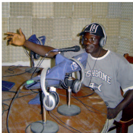
Chad: la Radio Efeta invita a todos a oír la palabra divina.