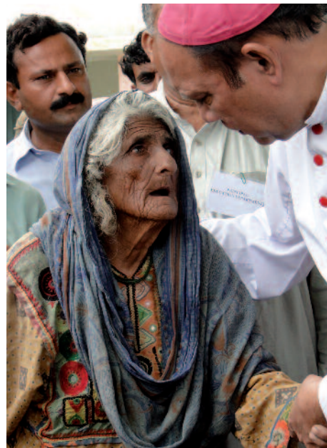
Consuelo tras el exilio provocado por las fuerzas de la naturaleza: el obispo Andrew Francis con las víctimas de las inundaciones en Pakistán.

Hace veinte años vivían en Irak 1,4 millones de cristianos; ahora son sólo unos 200.000. Son perseguidos y desplazados, e incluso asesinados por causa de Su Nombre. Los cristianos forman el “grupo religioso que ha sufrido más persecuciones a causa de su fe”.