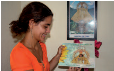
Carteles, calendarios y oraciones a la Virgen en Cuba.