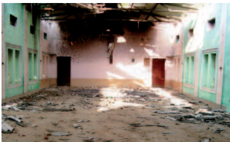
Capilla en construcción en Berhampur (India): no podemos dejarla así.

Julián Ceobanu, que erigió un centro parroquial en su parroquia de Maximiliano Kolbe en Moara (Rumanía). Pero en ese centro falta casi todo. Le hemos prometido una ayuda de 6 millones 218 mil pesos . Algo semejante sucede en otros países del antiguo bloque oriental. Después de 70 años, la minúscula parroquia de Haradok ( Bielorusia ) volvió a tener un párroco. Los fieles levantaron la iglesia que los comunistas habían dejado arruinarse. Luego se ocuparon de la casa rectoral, que ha de ser utilizada también para encuentros y para la catequesis. Pusieron los cimientos, alzaron los muros y fabricaron las puertas, pero para el tejado ya no tuvieron dinero. ¿De qué sirve la buena voluntad si no se tienen medios? 9 millones 327 mil pesos para el tejado. ¿Quién colabora a ello? ●