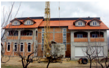
Un gran futuro gracias a ustedes: centro diocesano, casi terminado, en Lituania.