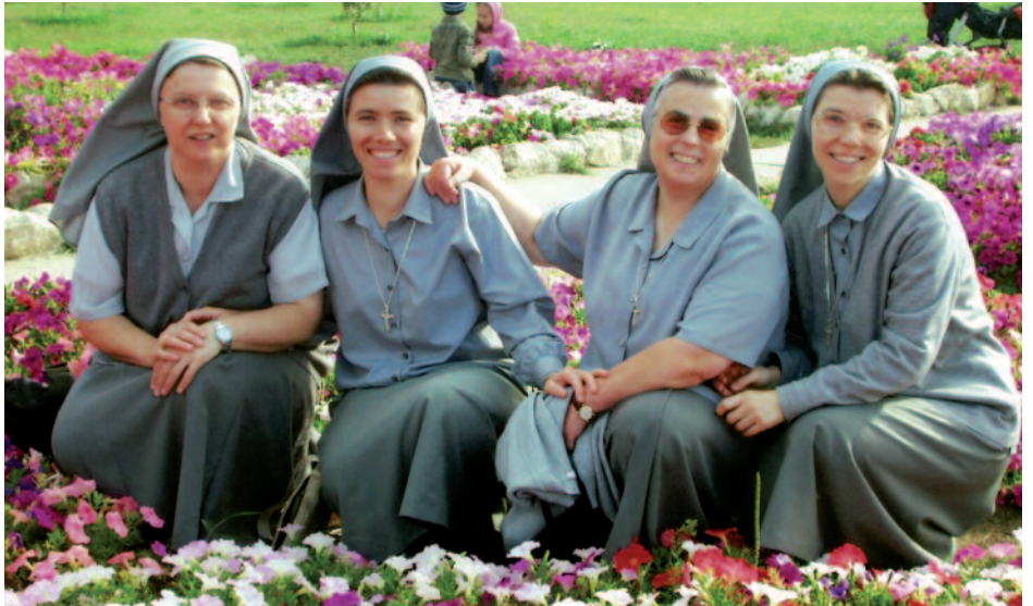
Religiosas en Moldavia: ustedes las ayudan a construir un centro pastoral.

Muchas parroquias esperan decenios a tener tal espacio. A la parroquia greco-católica de Halmajd, en Rumanía , le quitaron los comunistas la iglesia en 1948. Desde hace 15 años tiene de nuevo un sacerdote, pero carece de iglesia. Las misas se celebran en un aula de clase o en casas particulares. Estos espacios son demasiado pequeños. Ahora tienen un solar en el centro de la aldea. Allí va a ser edificada una pequeña iglesia, un “espacio de adoración eucarística”, con 100