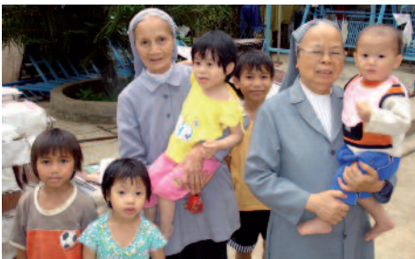
Excepto ellas, nadie ayuda: religiosas con niños impedidos en Vietnam.