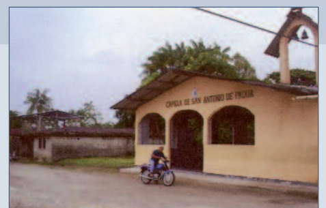
Impulso para todo y para todos: la capilla de San Antonio en Guapi (Colombia).

ción, crean escuelas en el campo, y a menudo, aun siendo ellos tan pobres como sus parroquianos, son la última tabla de salvación cuando se trata de pagar una factura. El obispo Hernán Alvarado Solano tiene párrocos como éstos en su pobrísimo vicariato de Guapi ( Colombia ). Y tampoco él tiene nada para financiar la casa parroquial en la futura parroquia de San Antonio. Pero sin la casa parroquial le faltará a la parroquia un lugar de paz, de justicia, de misericordia, de tranquilidad y de reposo, donde el mismo párroco pueda recobrar fuerzas.