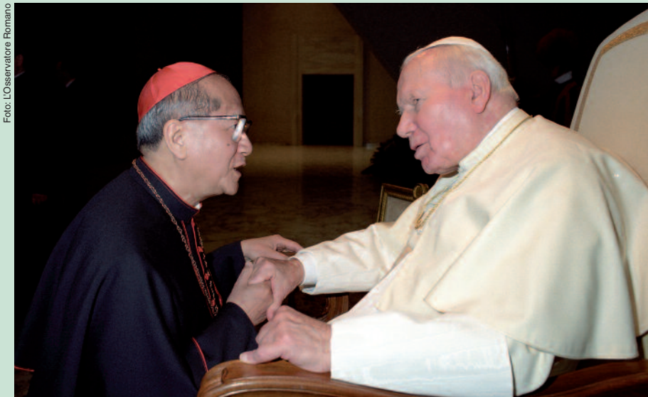
Marcados por el dolor: el Cardenal Nguyen Van Thuan y Juan Pablo II.

“Nuestros hermanos perseguidos son la élite de la Iglesia; ser solidarios con ellos es una cuestión de honor”.